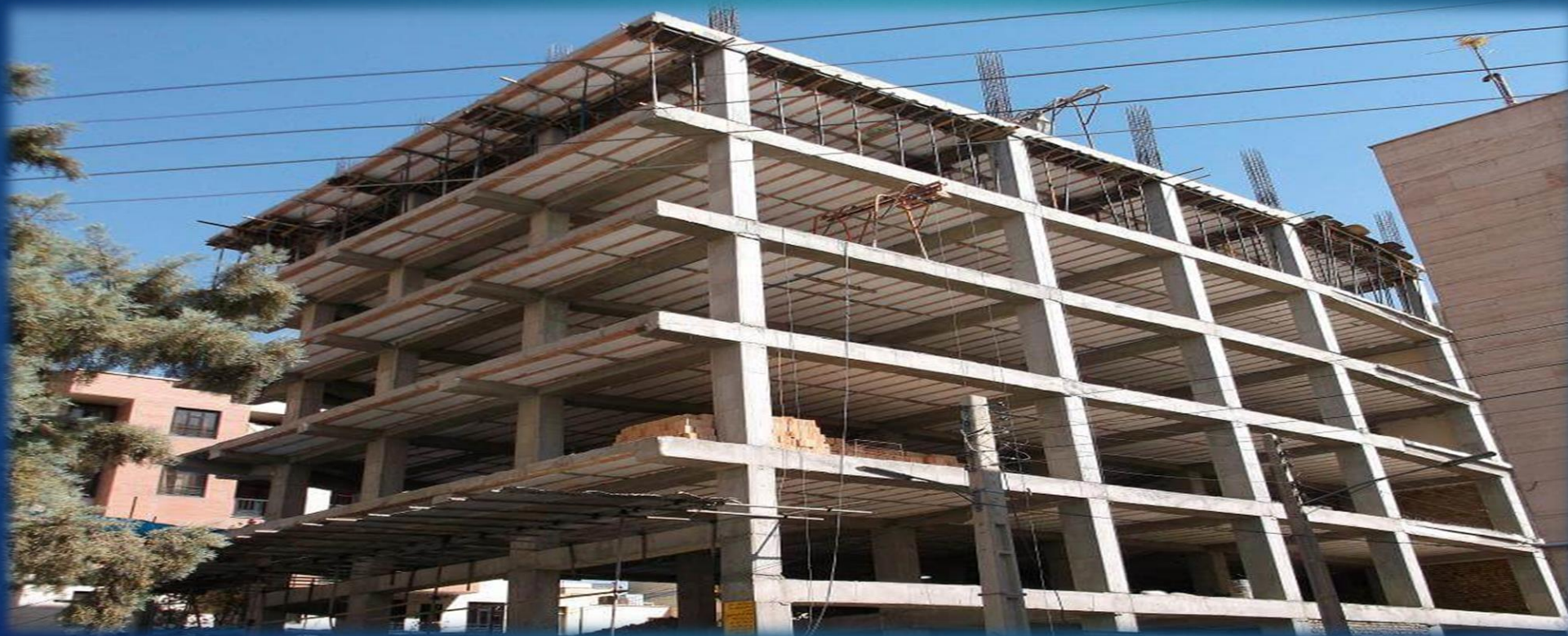
کارفرما : مآج آقا افشار شهرک گلستان یاس ۱۴

◀ مجری سازه های بتونی و فونداسیون و دیوارهای بتونی : نوسان با بهره گیری از اکیپ های ماهر و تجهیزات خود قادر به اجراء فونداسیون ، اسکلت و دیوارهای بتنی با بهترین کیفیت و در کوتاهترین زمان ممکن را دارا می باشد .